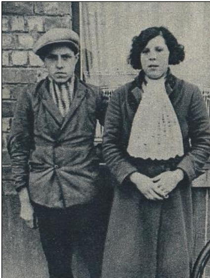
De twee kinderen uit het eerste huwelijk van Irma Dhaenens.

Zij huwde met hem in 1928 en het koppel vestigde zich in de Ketelstraat. Maar de man kon de kinderen uit haar eerste huwelijk niet uitstaan. In 1933 kreeg het echtpaar Rodts-Dhaenens zelf een kind.