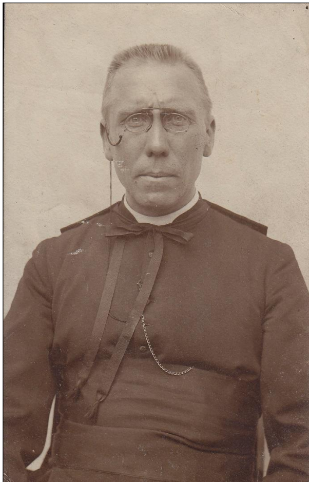
Den Abbé werd dood gevonden in zijn vijver.

Toen die er nog steeds niet was, stuurde hij de koster of misdienaar naar de woning om te vragen wat er haperde. De 70-jarige vader was juist opgestaan, ging naar de kamer van zijn zoon en zag dat die niet in bed was geweest. De man had onmiddellijk een slecht voorgevoel dat er iets was voorgevallen. De zuster van den abbé was niet thuis. Hij begaf zich naar zijn buurman, notaris Van Roy. Ook de jonge Michiels van 'In den Vos' werd erbij geroepen en samen begonnen ze een zoektocht in de tuin.