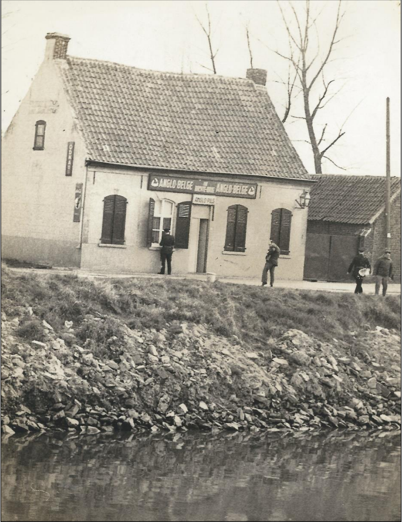
Herberg waar Zulma werd vermoord.