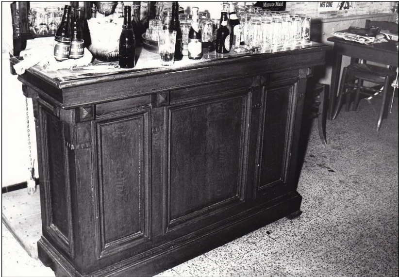
Café Bachte-Brug met het bierglas met onbekende vingerafdruk.

Maar het onderzoek liep op niets uit wegens te weinig aanknopingspunten. De vingerafdrukken werden allemaal gecontroleerd en konden op één vin- gerafdruk op een glas na allemaal worden toegewezen aan iemand.