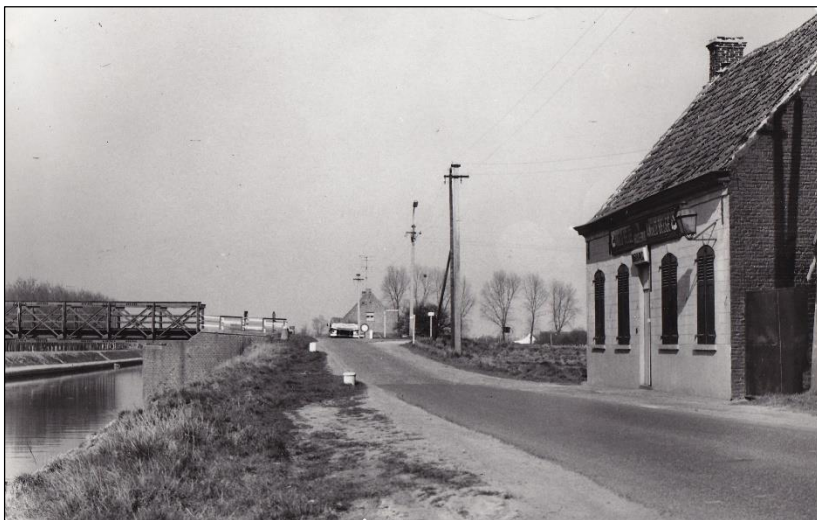
Café Bachte-Brug aan Bachtebrug. Beide werden rond 1980 afgebroken.

Een wanhoopsdaad werd door de onderzoeksrechter dan ook uitgesloten. Zij had de naam er warmpjes in te zitten. Bachte-Brug was een zeer drukbe klant landelijk café. Zij had echter de avond voordien aan een handelaar uit een naburige gemeente laten weten te zullen stoppen met de herberg, want het pand zou binnen een paar maanden worden onteigend voor de verbreding van het Kanaal van Schipdonk.