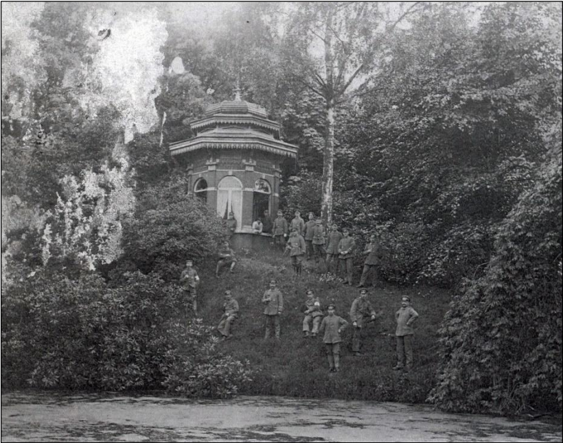
Duitse soldaten in 1916 aan de grote tuinvijver op het einde van de Langemunt, waar in 1906 pater Valère Dujardin vermoord werd aangetroffen door zijn vader en de bureu.

Op 5 juni 1906 stonden Nevele en Vosselare in rep en roer, toen die morgen in de grote vijver aan zijn woning, mijnheer den abbé, zoals hij in de wandeling werd genoemd, dood werd aangetroffen. Eene massa dorpingen zijn naar de plaats gesneld waar het drama gebeurde schreef Vooruit van 6 juni.